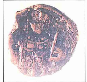
I. Mesud'a ait bakır sikke (Yapı ve Kredi Bankası Sikke Koleksiyonu, nr. 4872)