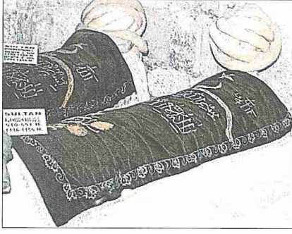
I. Mesud'un lahdi

camii o dönemin Anadolu'daki ulucamileri üslûbunda yani kubbesiz, tavanı düz ve çok sütunlu olarak yapılmıştı. Alâeddin Camii'nin inşasına Sultan I. Mesud zamanında başlanmış, ancak I. Alâeddin Keykubad devrinde tamamlandığı için onun adını almıştır. Sultan ayrıca Aksaray'da bir camii ile Amasya yakınlarında Simre adlı bir şehir tesis ettirmiştir. Anadolu Selçuklularından günümüze intikal eden en eski tarihli sikke Sultan Mesud'a aittir. Tarih ve darp yeri bulunmayan bu bakır sikkeler (mangır) üzerinde "es-Sultânü'l-muazzam Mes'ûd b. Kılcarşlan" yazılıdır. Anadolu'ya Sultan Mesud zamanına gelinceye kadar "Romania" (Romalılar ülkesi) deniliyordu. Onun devrinde Batılılar Anadolu'yu "Turchia" (Türkiye) adıyla anmaya başlamıştır. Ermeniler'in de Anadolu'nun Türkler'in hâkimiyetinde bulunan büyük kesimine "Türkistan" adını verdikleri görülür.