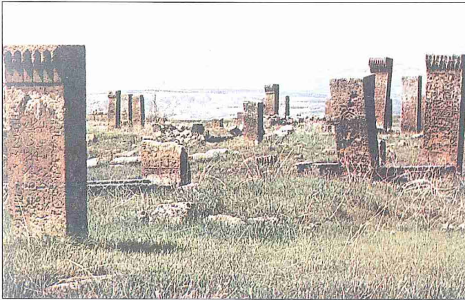
Ahlat Mezarlığı'ndan bir görünüş

Mezarın baş ve ayak ucuna "şâhide" veya "mezar taşı" (halk arasında "hece taşı") denilen taşların dikilmesi İslâm'ın ilk dönemlerinden beri devam eden bir gelenektir. Hz. Peygamber'in, tanınması için Osman b. Maz'un'un kabrinin başına taş diktiği (Ebû Dâvûd, "Cenâ'iz", 63), onun vefatından sonra bazı sahâbi ve tâbiin mezarlarının üzerine kubbe adı verilen çadır kurulduğu bilinmektedir. Bunlardan biri Hz. Hasan'ın oğlu Hasan'ın kab-