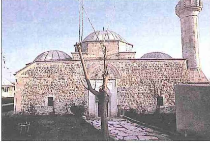
Mezid Bey Camii ve planı

liktedir. Binada inşa malzemesi olarak taş ve tuğla kullanılmıştır. Tabhânelerin cepheleri düzgün kesme taş, diğer cepheler ise dikey almaşık örgülüdür. Bu almaşıklık bir sıra düzgün kesme taş, iki sıra tuğla hatıl sıralarıyla oluşturulmuştur.