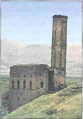
Menûçîhr Camii – Kars

Caminin planı pek düzgün olmayan bir dikdörtgen şeklinde olup (18,5 × 15,7 m.) yapı çift katlı olarak düzenlenmiştir. Alt