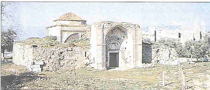
Ahmed Gazi Medresesi – Peçin / Muğla

Bir liman şehri olan Mekri / Meğri'de de (Fethiye) Gazi Ahmed Bey devrinde çeşitli sivil ve dinî yapıların inşa edildiği bilinir. Burada Ahmed Bey kendi adına bir cami ve medrese yaptırmış (BA, a.g.e., nr. 338, s. 126, 135), bu medrese 1473 Ağustosunda Venedik donanmasının saldırısı sonucunda yıkılmış ve Hacı İvaz ta-