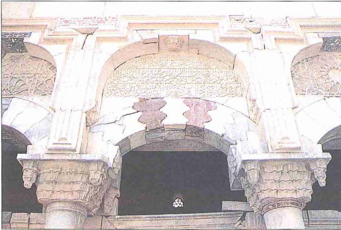
İlyas Bey Camii'nin giriş cephesinden detay