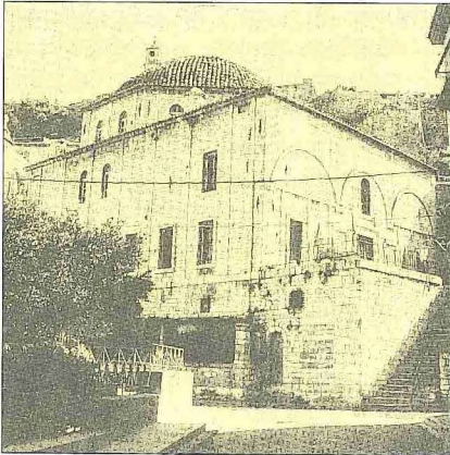
Anabolu'da bugün tiyatro olarak kullanılan bir cami

Günümüzde Türkiye'nin Asya kesimindeki topraklarına verilen Anadolu ismi, Ortaçağ'dan beri çeşitli büyüklükte birimler için kullanılmıştır. Bazan bir idarî bölge, bazan da memleket için kullanılan bu adın içine aldığı alan da zamanla değişikliğe uğrayarak doğuya ve güneydoğuya doğru genişlemiştir. Anadolu adı henüz yaygınlaşmadan önce, aşağı yukarı aynı alan içinde kalan bölgeler için Küçük Asya (Asia Minor) adı kullanılıyordu. Bu kavram zaman içinde sahasını