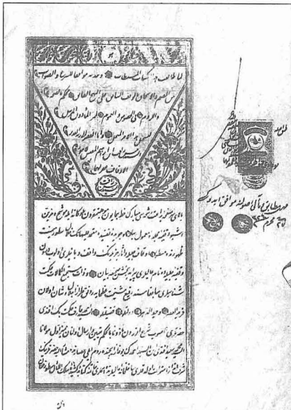
Arif Hikmet Kütüphanesi'nin vakfiyesinden bir sayfa (VGMA, nr. 14, s. 32)

Ârif Hikmet Tezkiresi'nde III. Selim'in şiirlerinden örneklerin yer aldığı bir sayfa (Millet Ktp., Ali Emîrî, Tarih, nr. 789, nr. 2 b )