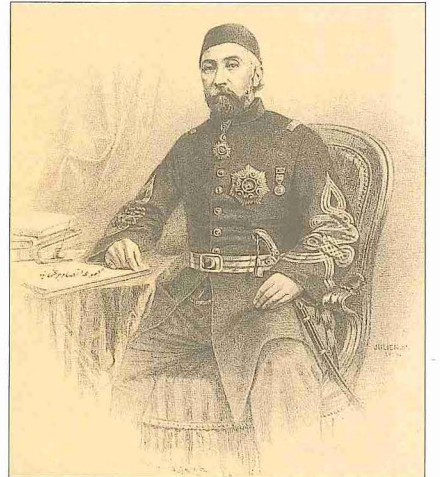
Ârif Mehmed Paşa

Türkiye'de Batı tarzı resim sanatının öncülerinden biri olan Ârif Mehmed Paşa, 9 Zilhicce 1222'de (7 Şubat 1808) İstanbul'da doğdu. Babası, kapı çuhadarı İrfanzâde İsmâil Rifat Efendi'dir. On dört yaşında Maliye Kalemi'ne, on sekiz yaşında da kendi isteğiyle yeni kurulan Asâkir-i Mansûre-i Muhammediyye'ye kâtip oldu. 1242 (1826-27) yılında Rumeli'de Eğriboz ve Atina taraflarında iki yıl hizmet gördü. İstanbul'a döndükten sonra 1829'da nefer olarak "tüfenkçi" sınıfına geçti. Nefer ve başçavuş olarak dört yıl hizmetten sonra Sadr-ı Esbak