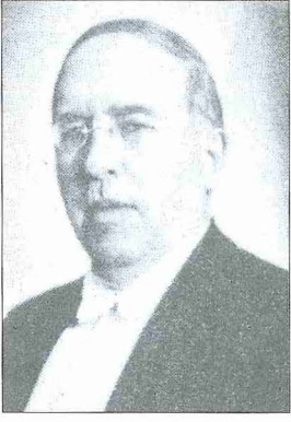
Sadri Maksudi Arsal

1917 Rus İhtilâli'nden sonra Kazan yöresinde kurulan muhtar Türk devletinde hem Millet Meclisi başkanı, hem Millî İdare başkanı seçildi. Böylece İdil-Ural Devleti'nin ilk cumhurbaşkanı oldu. Bolşevizm'in Rusya'daki hâkimiyeti üzerine Finlandiya'ya geçip oradan Paris'e gitti. Sorbonne'a bağlı bir enstitüde akademik faaliyetlerine devam etti. I. Dünya Savaşı sonundaki ortamda her fırsatta Türkler'in haklarının korunmasına çalıştı. Sorbonne Üniversitesi'ne bağlı Slav Kavimleri Araştırma Enstitüsü'nün serbest dersleri olarak Türk-Tatar kavimleriyle Orta Asya tarihi okuttu. Bu dersler yanında Journal Asiatique 'te bazı yazılar yazdı ve ilmî faaliyetlerde bulundu. Bir süre sonra Maarif Vekili Hamdullah Suphi (Tanrıöver) tarafından Türkiye'ye davet edildi (1925). Önce Telif ve Tercüme Heyeti üyeliğine, sonra yeni açılan Ankara Adliye Hukuk Mektebi'ne profesör tayin edildi. Aynı zamanda Türk Ocakları Hars Heyeti üyesi idi. Adliye Hukuk Mektebi daha sonra Hukuk Fakültesi olunca uzun yıllar burada umumi hukuk tarihi, Türk hukuk tarihi ve hukuk felsefesi dersleri okuttu. Türk Ocakları'nın 1930 yılı kurultayında yalnız tarihle uğraşacak bir tarih encümeni veya tarih akademisi kurulması gereği hakkındaki bir konuşması üzerine, Afet İnan'ın bu görüşü desteklemesiyle bugünkü Türk Tarih Kurumu'nun temeli atılmış oldu.