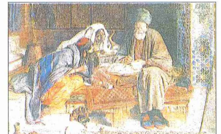
J. Frederich Lewis'in "Arap Arzuhalci" adlı sulu boya tablosu (Londra Güzel Sanatlar Galerisi)