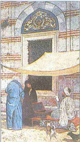
Osman Hamdî'nin "Arzuhalci" adlı tablosu (H. Vahit Kerem koleksiyonu)

Sadrazama da çok değişik mahiyette arzuhaller sunulurdu. Tayinlerle ilgili olarak verilen arzuhallerde sadrazam kethüdâsı arzuhalin sağ üst köşesine "mahalli görüle" ibaresini yazarak bunu başmuhasebe, mevkufat, ruûs kalemi veya defterhane gibi kalemlere, eski kaydının çıkarılması ve gerekli bilginin verilmesi için gönderirdi. Arzuhal burada incelendikten sonra o memuriyet veya cihet* in münhal olup olmadığı, daha önce ve o sırada kimin üzerinde olduğu gibi bilgiler derkenar* olarak yazılır, al-