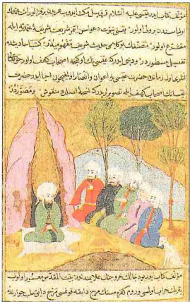
Hz. İsa ile Ashâb-ı Kefh'i tasvir eden bir minyatür (Terceme-i Cifri'l-câmi', İÜ Ktp., TY, nr. 6624, vr. 99 a )

Ashâb-ı Kefh'in Hz. İsa'dan önce mi yoksa sonra mı yaşadığı, dolayısıyla hangi dine mensup olduğu konusunda da bir açıklık yoktur. Kehf süresinin nüzül sebebi ile ilgili rivayete göre, Medine yahudileri, Kureyş müşrikleri tarafından akıl danışmak üzere kendilerine gönderilen Nadr b. Hâris ile Ukbe b. Muayt'a, üç şeyi Peygamber'e sormalarını tavsiye ederler; eğer bilirse gerçek peygamber olduğunu, aksi halde peygamber olmadığını söylerler. Medine yahudilerinin Peygamber'e sorulmasını istedikleri ilk soru Ashâb-ı Kefh'le ilgilidir. Bu sebeple onları Hz. İsa'dan önce yaşadıkları ileri sürülmüştür. Nitekim Ebû'l-Hasan el-Mâverîfi bu gençlerin Hz. İsa'dan önce yaşadıklarını söylemektedir ( A'lâmü'n-nübüvve , s. 36). Diğer taraftan rakîm kelimesinin etimolojisinin de gösterdiği üzere genel olarak bu kelime "yazılı belgeler" anlamına geldiğine göre Kur'an'daki "Ashâb-ı Kefh ve'r-rakîm"i, yazdıklarını mağaralarda muhafaza eden Essenîler veya onların öncülleri olarak anlamak da mümkündür. Çünkü Kur'an'da (el-Kehf 18/21), onların buldukları yere bir mescid yapıldığı ifade edilmekte, Essenîler de kendi mâbedlerine "mescid" demektedirler ( Revue Biblique , s. 234). Kur'an-ı Kerim ise hıristiyan kileselerini ve yahudi sinagoglarını ifade için mescid kelimesini kullanmamakta, onları "savâmi", "biya" ve "salevât" olarak zikretmektedir (el-Hac 22/40). Ayrıca Ashâb-ı Kefh kıssasında yiyeceklerle ilgili olarak kullanılan "ezkâ" (أزكى)