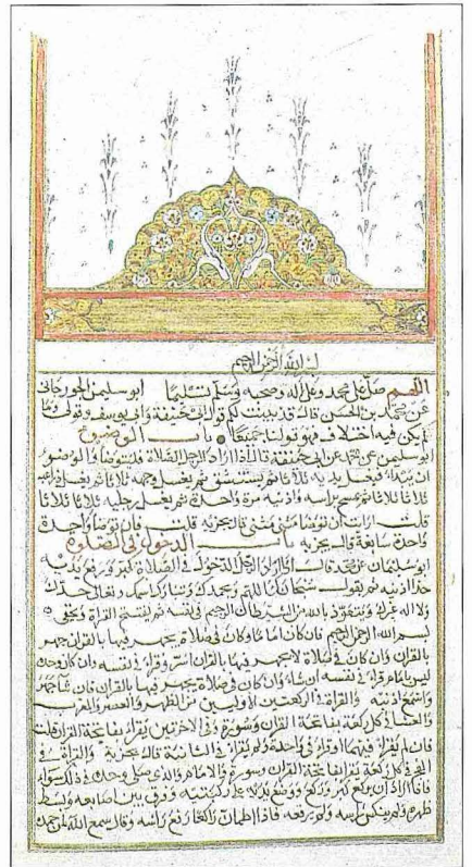
el-Asl'ın Ebû Süleyman el-Cüzcânî rivayetinin ilk sayfası (Süleymaniye Ktp., Ayasofya, nr. 1026)

İmam Muhammed'in ilk ve en hacimli eseri olup el-Mebsût diye de bilinmektedir. Ebû Hanife'nin görüşlerinin esas alındığı eserde kendisinin ve Ebû Yûsuf'un ona katılmadıkları konulardaki farklı görüşlere de yer verilmiştir. İhtilâfın zikredilmediği hususlarda Ebû Hanife ve iki talebesinin aynı görüşte olduğu anlaşılır. Yer yer İbn Ebû Leylâ'nın ihtilâflarının da zikredildiği ve genelde fik-