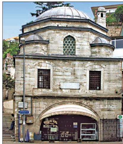
Mihrimah Sultan Kütüphanesi – Üsküdar / İstanbul

Çocuk kütüphanesine dönüştürülmüş sibyan mektebi, yazlık dershane olarak kullanılan kubbeli bir revak ve bununla eş büyüklükteki kışlık mekândan oluşmaktadır. Ağır bir kütesel görünüme sahip sibyan mektebi, meyilli bir arazi üzerine yerleştirildiğinden kışlık dershanesi bir subasman ile yükseltilerek ön kısmın-