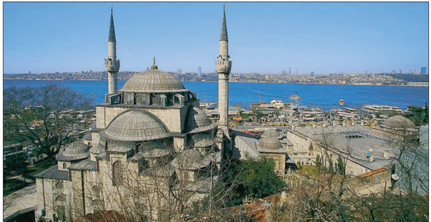
Mihrimah Sultan Külliyesi – Üsküdar / İstanbul

İskele Camii olarak da tanınan ve külliyein çekirdeğini teşkil eden cami, merkezi kubbeyi üç yönde destekleyen yarım kubbelerden oluşan harim kısmı ile beş kubbeli son cemaat yeri ve bunu üç yönde çeviren ikinci bir son cemaat mahallinden meydana gelmektedir. Dikdörtgen