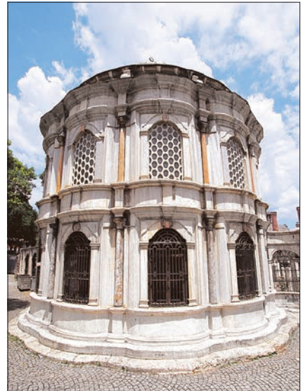
Mihrîşah Vâlîde Sultan Türbesi - Eyüp / İstanbul

Türbe, Beyaz mermerden, on iki oval yüzlü, çift sıra pencereli ve kubbeli bir yapının cephelerindeki pencereler arasında duvarlara gömülü sütunlar ve köşeli pilastırlar yer alır. Pencere atlarında ve üstlerinde bulunan yatay siltmelerle, bun-