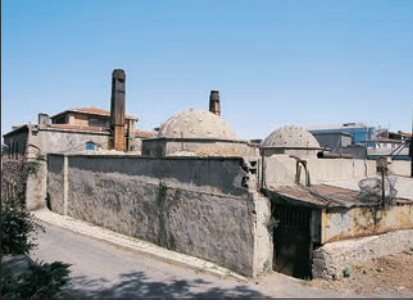
Mihrimah Sultan Hamamı – Edirnekapi / İstanbul

bir daha evlenmedi. Bu sırada Şehzade Selim'den yana ağırlığını koydu. Rüstem Paşa ile evliliklerinden Ayşe, Hü mâşah ve Osman adında üç çocukları olmuştur.