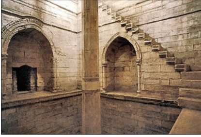
Mikyâsü'n-Nîl'in içinden bir görünüş

Süleyman b. Abdülmelik tarafından kurulan ve 247'de (861) Mütevekkil -Alellah'ın emriyle matematikçi Fergânî'ye ihya ettirilen el-Mikyâsü'l-kebîr'dir (Mes'ûdî, I, 334; İbn Ebû Usaybia, s. 287; Makrîzî, I, 58). Tarihî metinlerde 247'den (861) sonra rastlanan atfların tamamı bu mikyasla ilgilidir. Ardından Mısır'ı yönetenler yapının bakım ve onarımına özen göstermişlerdir. Meselâ Tolunoğulları'nın kurucusu Ahmed b. Tolun 266'da (879) bakımı için 1000 dinar tahsis etmiş, Fâtîmî Halifesi Müstansır-Billâh devrinde bazı yerlerinde değişikliğe gidilerek yanına bir mescid inşa edilmiş ve 638'de (1241) etrafını çevreleyen kalın bir duvarla koruma altına alınmıştır. XV. yüzyılın başında ve 872-873 (1467-1468) yıllarında, ayrıca 886 (1481) depreminden sonra Sultan Kayıtbay'ın emriyle esaslı bir şekilde onarılan yapının üzerine Yavuz Sultan Selim 923'te (1517) bir çatı inşa ettirmiştir. Osmanlılar tarafından düzenli biçimde bakımı sürdürülen, 1180 (1766) yılı ile Fransızlar'ın Mısır'ı işgali (1798-1801) sırasında ve daha sonraları tekrar onarılan mikyas halen faal durumdadır.