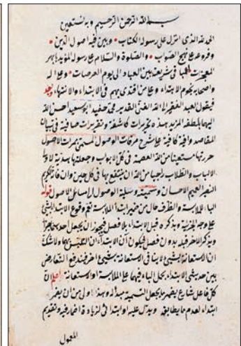
Ebû Saîd Hafidü'n-Nisârî'nin Mir'âtü'l-üşûl 'e yazdığı Vesiletü'l-vüşûl ilâ mesâ'ili'l-üşûl adlı hâşiyenin ilk iki sayfası (Süleymaniye Ktp., Hamidiye, nr. 425)