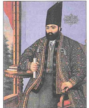
Mirza Takî Han

İrân'da sadâret makamına ulaştıktan sonra siyasî, ekonomik ve sosyal alanlarda birçok problemle karşılaşan Mirza Takî Han bunları çözüme kavuşturmak ve ülkeyi daha iyi bir seviyeye ulaştırmak için bir dizi ıslah hareketi başlattı. Buna zemin hazırlamak amacıyla kötü gidışten sorumlu tuttuğu birçok eski vali ve yöneticiyi görevden aldı. Mirza Âkâ Han Nûrî başta olmak üzere pek çok kişi onun sadârete getirilmesinden hoşlanmadı ve makamından uzaklaştırılması için entrikalara başladı. Tahran'da toplanan Azerbaycanlı askerler Mirza Takî'nin görevden alınıp idam edilmesini istedilerse de bu girişim sonuçsuz kaldı (1849). Bâbilîğin kurucusu Seyyid Ali Muhammed Bâb'ın çıkardığı isyan da bastırıldı ve kendisi Tebriz'de idam edildi (1266/1850). Bunları diğer bazı isyan hareketleri izledi. Meşhed'