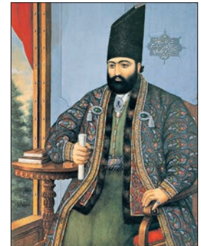
Mirza Takî Han

İran'da sadâret makamına ulaştıktan sonra siyasi, ekonomik ve sosyal alanlarda birçok problemle karşılaşan Mirza Takî Han bunları çözüme kavuşturmak ve ülkeyi daha iyi bir seviyeye ulaştırmak için bir dizi ıslah hareketi başlattı. Buna zemin hazırlamak amacıyla kötü gidışten sorumlu tuttuğu birçok eski vali ve yöneticiyi görevden aldı. Mirza Âkâ Han Nürî başta olmak üzere pek çok kişi onun sadârete getirilmesinden hoşlanmadı ve makamından uzaklaştırılması için entrikalara başladı. Tahran'da toplanan Azerbaycanlı askerler Mirza Takî'nin görevden alınıp idam edilmesini istedilerse de bu girişim sonuçsuz kaldı (1849). Bâbîliğin kurucusu Seyyid Ali Muhammed Bâb'ın çıkardığı isyan da bastırıldı ve kendisi Tebriz'de idam edildi (1266/1850). Bunları diğer bazı isyan hareketleri izledi. Meşhed'