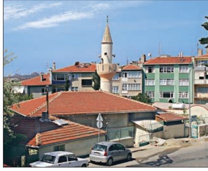
Sultantepe'de Mirzazâde Şeyh Menmed Efendi Camii – Üsküdar / İstanbul

Önce ulemâ çocuklarına has bir uygulamayla tahsilini süratle tamamlayıp ruus imtihanını kazanarak mûsile-i Süleymâniyye derecesine ulaştı. Ardından kayınpederi Fezullah Efendi'nin desteğiyle "tafra" hareket yani sıra gözetmeden iltimas ve imtiyazla, beklemeksizin üst derecelere süratle yükseldi, müderrislik ve