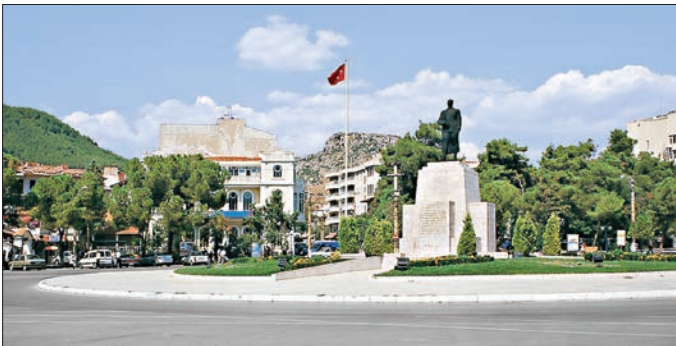
Muğla şehir meydanından bir görünüş

XVI. yüzyılda Muğla'nın sosyal yapısı çok çeşitlilik gösteriyordu. Şehirde ikamet eden şehzadeler ve sancak beylerinin emrinde kalabalık bir görevli topluluğu bulunuyordu. Bu yönetici kadronun varlığı Muğla'nın sosyal ve kültürel yapısını olumlu yönde etkiledi ve belli başlı şahsiyetlerin ön plana çıkmasına yol aç-