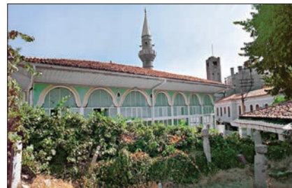
Şeyh Camii ve haziresi

906'da (1500-1501) Muğla kazasına bağlı otuz altı köy bulunuyordu. 923 (1517), 970 (1562) ve 991 (1583) tahrirlerinde sayı değişmedi. Bu tarihten sonra civardaki göçebe aşiretlerin iskân edilmesiyle ortaya yeni köyler çıkmaya başladı. 1030 (1621) tarihli avâriz tahririnde Muğla'ya bağlı Yerkesik, Dadya (Daçça) ve Tarahya köyleriyle Ula kasabası kaza olarak kaydedilmiştir (BA, MAD, nr. 2447, s. 47-51; nr.