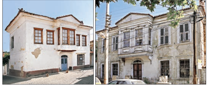
Eski Muğla evleri

Kızılcadere, Mescid-i Deksikli, Mescid-i Süfî Hüseyin, Hacı Timurhan, Yenicami (Emîr-i Küçük, Pisili Hâce) ve Mescid-i Hacı Mustafa isimlerini taşıyan mahalleler arasında bu tarihte nüfus açısından en kalabalık olanları Câmi-i Kebîr (yetmiş yedi hâne), Mescid-i Kadı (yetmiş beş hâne), Mescid-i Deksikli (yetmiş üç hâne), [Mescid-i] Hacı Timurhan (altmış üç hâne) ve Yenicami (elli altı hâne) mahalleleriydi. Mescid-i Kızılcadere mahallesinde sadece bir hâne ikamet etmekteydi. Bu tarihte şehrin toplam nüfusu 2950-3000 dolayında idi. 970 (1562) yılında aynı mahalleler şehrin yine en kalabalık mahalleleri olmakla birlikte Câmi-i Kebîr mahallesinin dışında diğerlerinin nüfusunda azalma görülmektedir. Bu tahririn sonuçlarına göre Muğla'nın nüfusu 2900 civarında idi (BA, TD, nr. 337, vr. 84 a -85 b ). 991'deki (1583) sayımda nüfusu 3600'e yükselen şehrin (TK, TD, nr. 110, vr. 81 a -83 b ) en kalabalık mahallesi Kadı Mescidi mahallesi olmuştur. Ardından sırasıyla Câmi-i Kebîr, Mescid-i Deksikli ve Yenicami mahalleleri gelmektedir. Câmi-i Kebîr mahallesinin yüzyıl boyunca demografik durumunu muhafaza etmesinin en önemli sebebi şehrin sosyoekonomik merkezinde bulunmasına bağlıdır. Nüfusun, Câmi-i Kebîr mahallesinden Kadı Mescidi mahallesini geçerek şehrin güney ucundaki Yenicami mahallesine uzanan ekonomik hat boyunca yoğunlaştığı farkedilmektedir. Hacı Muslihuddin'in 898 (1493) yılında inşa ettirdiği külliye, şehrin kuzeyindeki ulucaminin