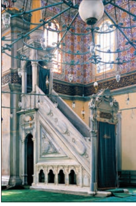
Üsküdar Selimiye Camii'nin minberi

bul Rüstem Paşa (1558-1561), Edirnekapı Mihrimah Sultan (1562-1565), Fındıklı Molla Çelebi (XVI. yüzyıl ikinci yarısı) ve Edirne Selimiye (1569-1574) camilerinin minberleri yan aynalıklarında kafes oymalı göbekler bulunan klasik örneklerdir. Lüleburgaz Sokullu Camii'nde de (XVI. yüzyılın ikinci yarısı) aynı düzenleme devam etmekle birlikte kafes araları daha geniş bırakılmıştır. Küçük Ayasofya (XVI. yüzyılın başları), Kasımpaşa Piyâle Paşa (980/1572-73) ve Gölarmara Halime Hatun (XVI. yüzyıl sonu) camilerinin minberleri değişik örnekler oluşturmaktadır. Bunlardan Küçük Ayasofya Camii'nin minberindeki yan aynalarda yer alan kemerli açıklıklar daha büyük ve farklı düzendedir. Piyâle Paşa Camii'nin süslemesiz minberinde bulunan yan açıklıkların boyutları değişmiş ve kademeli biçimde yükselen bu açıklıklardan en sonuncusu köşk altındaki geçitle aynı yüksekliğe ulaşmıştır. Gölarmara Halime Hatun Camii'nin mermerden yapılmış minberi yivli yarım kemerle duvara dayanmaktadır; titiz bir işçiliğe sahip minber değişik bir görünümündedir. Konya Sultan Selim Camii'nin minberi sade mermer yapısı, süslemeleri ve Mevlânâ Kümbeti'ni andıran yivli bir kaid üzerine oturtulmuş yivli çadır biçimindeki külâh ile önem taşımaktadır. Yine XVI. yüzyılda Diyarbakır Behram Paşa (1564-1572), Kadırga Sokullu Mehmed Paşa 979 (1571-72) ve Üsküdar Çinili 1050 (1640) camilerinin minber külâhları çiniyle kaplanmıştır.