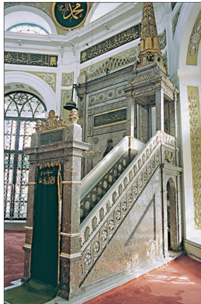
Fatih Hırka-i Şerif Camii'nin empire üslûbundaki minberi

üslûbunun başlıca temsilcileridir. Ertuğrul (1887) ve Cihangir (1890) camilerinin minberleri ise bu üslûbun ahşaba yansımış örneklerini oluşturur. Yine XIX. yüzyılda Doğu'dan ve Batı'dan gelen farklı üslûpların karışımı olan eklektik üslûpta geometrik geçmelerin yanı sıra külâh yerine kubbe kullanılmıştır. Bu üslûba giren Altunîzâde (1865), Aksaray Pertevniyal Vâlide (1871) ve Yıldız Hamidiye (1886) camilerinin minberleri taş malzemeyle yapılmış, Pertevniyal Vâlide ve Hamidiye'nin minberlerinde külâh yerine bombeli dilimli kubbeye yer verilmiştir. Kazasker Camii'nin (1902) ahşap ve Suadiye Camii'nin (1907) mermer minberleri de bu üslûpta ele alınmış diğer örneklerdir. Erenköy Zihni Paşa (1901), Göztepe Hâlis Efendi (1902), Bostancı Kuloğlu Mustafa Bey (1912) ve Bebek (1912) camilerinin ahşap minberleri ise XX. yüzyılın başında bu yabancı kökenli üslûplara tepki olarak ortaya çıkan ve millî mimariyi tekrar canlandırmaya çalışan neoklasik üslûbun başlıca ürünleridir.