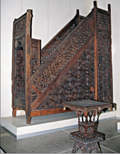
Ürgüp Demse köyündeki Taşkın Paşa Camii'nin XIV. yüzyılın ikinci yarısına ait ahşap minberi (Ankara Etnografya Müzesi)

teknisiyle yapılan Kayseri Hıncal Hatun Camii minberinin merdiven korkuluklarında dolgu kafes işçiliği uygulanmıştır. Divriği Ulucamii'nin (626/1229) minberinde çakma-kabartma künde-kârî tekniği kullanılmıştır; bunun korkuluklarında da dolgu kafes işçiliği görülür. Yan aynalıkların süslemeleri, çok köşeli iri yıldız motifleriyle ucu uzatılmış geometrik bir düzenlemeden meydana gelmektedir. Korkuluklarda asma dalları ve lotuslarla bezeli altıgen levhalar vardır. Aynı asırda yapılan Ankara Ahî Şerafeddin Camii'nin minberi çakma ve kabartma künde-kârî tekniğinde ele alınmıştır. Bu yüzyılın sonuna ait Beyşehir Eşrefoğlu Camii'nin minberleri ise teknik ve tezyinat bakımından Konya Alâeddin Camii'nin minberine benzerdir.