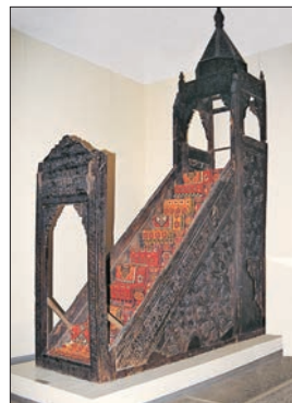
Siirt Ulucamii'nin ahşap minberi (Ankara Etnografya Müzesi)

Anadolu Selçukluları ve Osmanlılar. Anadolu Selçukluları'ndan kalan ve tamamı ahşap olan minberlerin en eskisi Konya Alâeddin Camii minberidir. Kitâbesinden 550 (1155) yılında tamamlandığı anlaşılan künde-kârî tekniğindeki minberin kapı açıklığı dilimli bir sivri kemerle, üç yanı firizlerle süslenmiştir; söveleri ise kozalaklarla son bulur. Üçgen biçimindeki taç kısmının ortasında küfî hatla yazılmış bir âyet bulunmaktadır. Aynalık kısmında altı köşeli yıldız motifinin tekrarıyla bir kompozisyon oluşturulmuş ve buraya caminin ilk bânisi Sultan I. Mesud'un adının geçtiği küfî kitâbe yerleştirilmiştir. Yan aynalıklarında, üzerleri rûmîler ve asma dallarından ince kabartmalarla bezeli geometrik geçmeler kullanılan minberin korkuluk şebekesi geometrik şekillerden meydana gelmiştir. Köşk kısmının