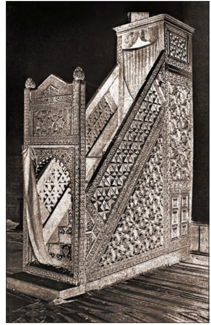
Konya Alâeddin Camii'nin hakiki künde-kârî tekniğinde yapılmış minberi

üstü sekizgen kasnaklı bir piramitle kapatılmıştır. XII. yüzyıla ait minberlerden diğer bir önemli örnek de Karaman Beyi II. İbrâhim tarafından Aksaray Ulucamii'ne götürülen Selçuklu minberidir. Kitâbesinden Sultan Mesud devrinde inşa edildiği anlaşılan eser künde-kârî tekniğinde yapılmıştır. Halen Harput Sâre Hatun Camii'nde bulunan ve aslında Harput Ulucamii'ne ait minber de aynı yüzyıldan olup hakiki ve taklit künde-kârî ile uygulama tekniklerinin bir arada kullanılmış olduğu bir örnektir.