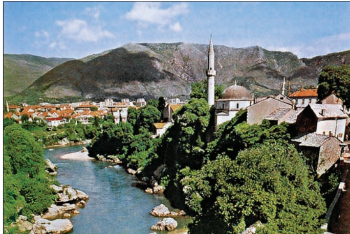
Mostar'dan bir görünüş

Mostar'ı 1074 (1664) yazında ziyaret eden ve burayı çok sıcak bulan Evliya Çe-