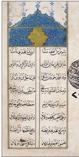
Muhsin-i Kayserî’nin Câmi’u’d-dürer adlı eserinin ilk sayfası (Süleymaniye Ktp., İsmihan Sultan, nr. 245)

Tahminen 1116’da (1704) İstanbul’da Molla Gürânî mahallesinde doğdu. 1143 (1730) yılında meydana gelen Patrona Halil İsyanı bastırılırken yeniçeri ağalığı gö-