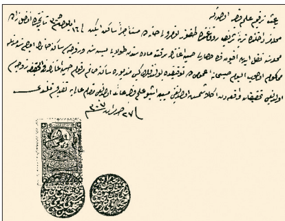
Akbiyik mahallesi muhtarı ve ileri gelenlerinin mühürlerini taşıyan kefaletnâme (BA, HH, nr. 25064, C)

Atik Ali Paşa mahallesi muhtarının verdiği ilmühâber (BA, Y. PRK. UM, nr. 26/58 lef 11)