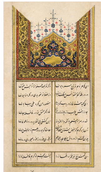
Muhteşem-i Kâşânî'nin Divan 'ının ilk iki sayfası (Süleymaniye Ktp., Hâlet Efendi, nr. 663.)