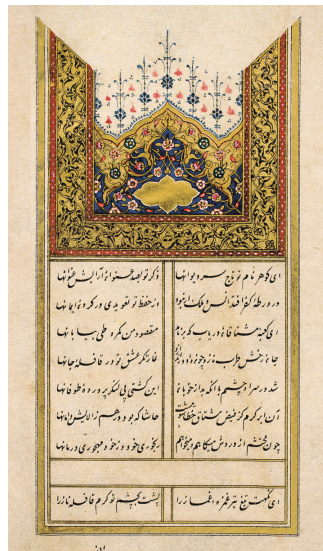
Muhteşem-i Kâşânî'nin Divan 'ının ilk iki sayfası (Süleymaniye Ktp., Hâlet Efendi, nr. 663.)