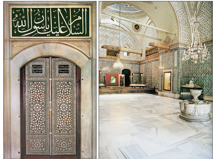
Hırka-i Saâdet Dairesi'nin kapısı ve Topkapı Sarayı'nda mukaddes emanetlerin bir kısmının sergilendiği şadırvanlı sofa

Dairenin güney kısmında eskiden, Emanet Hazinesi önünden başlayan ve ortada