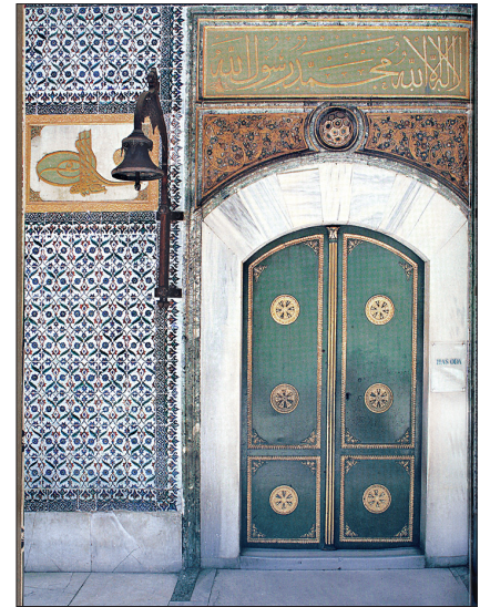
Mukaddes Emanetler Dairesi'nin kapısı

Sofanın doğusunda yer alan ve padişahın Enderun'daki arz ağalarıyla görüştüğü bir kabul salonu olan ilk odaya "arzhâne" denilir, ayrıca vâlide sultanın padişah olan oğluna "arslanım" diye hitap etmesinden dolayı "arslanhâne" denildiği de söylenir. Mekânın üzerini örten kubbenin kasnağında dört pencere vardır. Duvarlar XVI-XVIII. yüzyıllara tarihlendirilen İznik çinileri ile kaplanmış olup üstte mekânı çevreleyen kitabede Ahzâb sûresinin 38-44. âyetleri yazılmıştır. Arzhânede günümüzde nâme-i