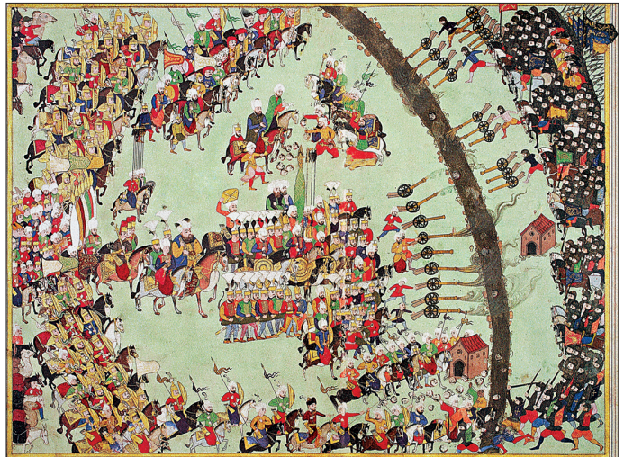
Hırka-i saâdetin Eğri seferinde III. Mehmed'in önünde baş üzerinde götürülüşünü tasvir eden bir minyatür (Tâlikizâde Subhi Çelebi, Eğri Fetihnâmesi , TSMK, nr. H 1609)

Topkapı Sarayı kompleksi içinde üçüncü avluyu oluşturan Enderun Meydanı'nın kuzeybatı köşesinde yer alır. Kare planlı bir zemin kat üzerine yapılmış uzun bir