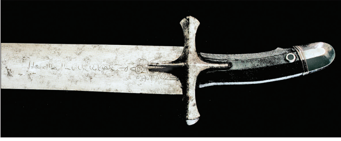
H. Dâvûd'a nisbet edilen kılıcın kabza kısmı (TSM, Envanter nr. 2/137)

Ayrıca Resûlullah'ın kâtibi Ebû'l-Hasan'a izâfe edilen bir kılıcın da (nr. 21/141) yine Hz. Ali'ye ait olması gerekir; çünkü bu künyeyi taşıyan kâtip Hudeybiye Antlaşması'nın metnini kaleme alan Hz. Ali'dir. Bir kısmı silâh bölümünde bulunan kılıçlara sonradan çoğu murassa' kabza ve kınlar yapılmıştır.