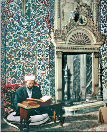
Hırka-i Saâdet Dairesi'nde Kur'an-ı Kerim okuyan hâfız

sofanın dış köşesinden bir zikzak çizerek Destimâl Odası önünde devam eden on üç kubbeli bir revak bulunmaktaydı. XIX. yüzyılda revakın sofanın güneybatısına düşen Destimâl Odası önündeki kısmı sofanın ön duvarının devamı niteliğinde, ancak daha ince (yaklaşık 9 cm.) bir duvarla kapatılıp Mukaddes Emanetler Dairesi görevlilerine yeni bir koğuş yapılmıştır. Bu tâdilâtta revaklar olduğu gibi bırakılarak önde kalan kısmın üstü beşik bir tonozla kapatılıp yaklaşık 12 x 23 m. genişliğinde bir oda elde edilmiştir. Bu odanın ön kısmına dışta kalan revakın devamı niteliğinde yapılan ilâve ile on bir kubbeli yeni bir revak oluşturulmuştur. Has Oda Kasrı'nın Haliç'e bakan iki cephesi de yalnız dört kubbeli blok devamınca on bir kubbeli bir revakla çevrilidir. Revaka sonradan çapraz tonozlarla örtülül bir sıra daha eklenmiş, bu tarafa ayrıca yeni bir teras ve havuz yapılmıştır. Bu duvarın dış kısmında ona sırtını veren bir çeşme bulunmaktadır. Çeşmenin barok alınlığı ortasında II. Mahmud'un tuğrası ve altında hizmetlerini öven ve dua içeren 1238 (1823) tarihli ta'lik hatla bir kitâbe yer alır. Ölen padişah ve şehzadelerin cenazeleri burada revak altına kurulan bir çadır içinde yıkanıp kefenlenirdi. Tabuta konan cenaze, Hırka-i Saâdet Dairesi'nin giriş kapısının solunda revak önündeki mermer seki üzerine konulup helâlik dilenir ve tezkiye edilirdi. Buranın hemen köşesinde mermer bilezikli ve bronz kapaklı kuyu önceleri su amaçlı kullanılırken daha sonra Has Oda temizli-