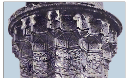
Hâce Alem Minaresi'nin mukarnasları (yıkılmadan önce)

Bir başka görüş en erken örneklerin Nişâbur'da bulunduğunu kabul eder. IX ve X. yüzyıla ait bu örnekler yine boyalı stuko parçalardır. İran bölgesinde konut mi-