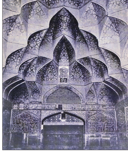
İsfahan Cuma Camii'nin batı eyvanındaki mukarnas uygulaması

Petekler dizisi ya da hücreler halinde istiflenmiş görüntü veren mukarnas, bulunduğu yerde hem taşıyıcı hem süsleyici işlev gördüğünden statik ve plastik görevleri birlikte üstlenerek diğer formlara göre çok farklı bir özellik taşır. Mukarnas, geometrik bir tasarımın üçüncü boyuta aktarılmış bir uygulaması olduğu için ışık-