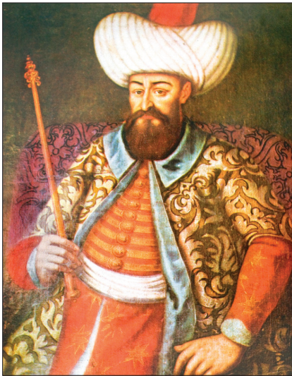
II. Murad'ı tasvir eden yağlı boya tablo (TSM, nr. 17/391)