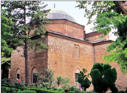
II. Murad'ın türbesi – Bursa