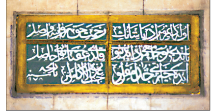
Murad Paşa Camii'nin inşa kitâbesi ile kible duvarındaki çini pencere alınlıklarından biri

zı olmayıp iki farklı zemin üzerine bitkisel kompozisyonlar uygulanmıştır.