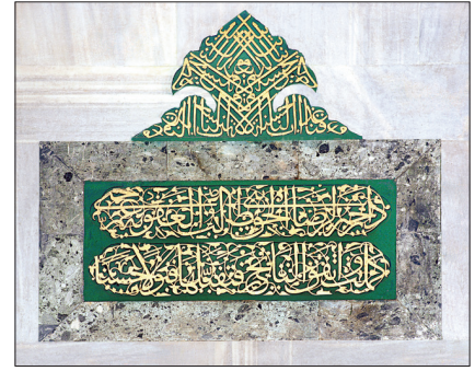
Murad Paşa Camii'nin cümle kapısı üzerindeki kitâbe

Sofa giriş cephesinde altta dikdörtgen çerçeveli, üstte sivri kemerli iki sıra pencere, diğer cephelerde yan akslarda yer alan tabhânelerden dolayı kasnağa yakın konumda bulunan bir sıra sivri kemerli pencere ile aydınlatılmaktadır. Kubbe kas-