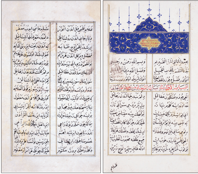
Murâdî'nin Kitâb-ı Feth-i Şikloş ve Estergon ve İstolni-Belgrad adlı eserinin ilk iki sayfası (Süleymaniye Ktp., Hekimoğlu Ali Paşa, nr. 700)