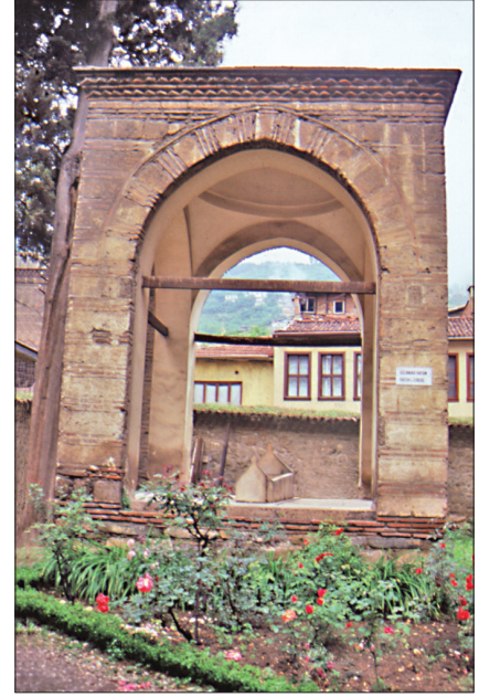
Ebe Hatun Türbesi – Bursa

rastlanmamıştır. İçinde iki kabir mevcut olup kimlere ait olduğu bilinmemektedir.