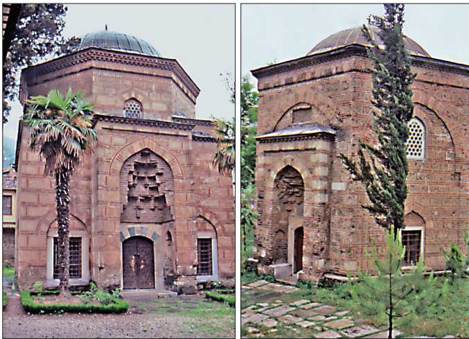
Gülruh Hatun ve Hümâ Hatun türbeleri

BA, İrade-Dahiliye, nr. 20363; BA, İrade-i Meclis-i Valâ, nr. 14251; Hasan Tâib, Hâtıra yahud Mir'ât-ı Bursa , Bursa 1323, s. 8; A. Memduh Turgut Koyunluoğlu, İznik ve Bursa Tarihi , Bursa 1935, s. 149-152; a.mlf., "Abideler", Uludağ , sy. 2, Bursa 1935, s. 31; sy. 3 (1935), s. 14-15; A. Gabriel, Une Capitale turque Brousse-Bursa , Paris 1958, I, 105-129, II, lv. XLVII-LXV; Ayverdi, Osmanlı Mi'mârisi II , s. 298-327; Ahmet Işık Doğan, Osmanlı Mimarisinde Tarikat Yapıları, Tekkeler, Zaviyeler ve Benzer Nitelikteki Fütüvvet Yapıları , İstanbul 1977, s. 209; Kâzım Baykal, Bursa ve Anıtları , İstanbul 1982, s. 38-43; Yüksel, Osmanlı Mi'mârisi V , s. 71-72, 423; M. Çağatay Uluçay, Padişahların Kadınları ve Kızları , Ankara 1985, s. 19, 21-29; Hakkı Önkal, Osmanlı Hanedan Türbeleri , Ankara 1992, s. 79 vd.; a.mlf., "Muradiye Türbeleri ve Şehzade Mustafa'nın Türbesi", Üçüncü Uluslararası Türk Kültürü Kongresi Bildirileri , Ankara 1999, s. 215-220; Şakir Çakmak, Erken Dönem Osmanlı Mimarisinde Taçkapılar (1300-1500) , Ankara 2001, s. 13, 17, 20, 22 vd.; Abdülhamit Tüfekçi-oğlu, Erken Dönem Osmanlı Mimarisinde Yazı , Ankara 2001, s. 189-192; Kâmil Kepeciöğlu, "Muradiye Türbeleri", Uludağ , sy. 3, Bursa 1935, s. 37-40; sy. 4 (1935), s. 42-44; Semavi Eyice, "İlk Osmanlı Devrinin Dini-İçtimai Bir Müessesesi: Zâviyeler ve Zâviyeli Camiler", İFM , XXIII-1-2 (1963), s. 38; Erhan Yıldızalp, "Muradiye Külliyesi", Bursa Defteri , sy. 19, Bursa 2003, s. 113-119.