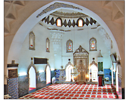
Bursa Murâdiye Camii'nin içinden bir görünüşü

Girişte, tavanda yer alan yirmi dört kollu yıldızlardan gelişen geometrik süslemeli muhteşem ahşap göbek daha önce mihrap kubbesinin batı ayağı dibinde bulunan müezzin mahfiline ait olup 1855'ten sonra yapılan onarım esnasında bu-