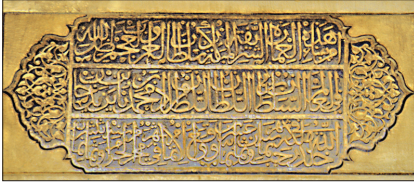
Bursa Murâdiye Camii'nin cümle kapısı üzerindeki inşa kitâbesi

üslûbunda olup hem kavsarası hem süslemesi devrin özelliklerini yansıtır. Yanan minberin yerine birkaç basamaklı, son derece basit olarak yenisi yapılmıştır. Civar köylerin birinden getirilip buraya monte edildiği hakkında bir rivayet de bulunan 1315 (1897-98) tarihli ahşap minber, mihrabın üslûbu ile benzerlik göstermediği gibi beyaz yağlı boya ile boyanmıştır. Tuğla iki minareden doğuda olanı eskidir ve hem aşağıdan hem asma kattan girişi vardır. Batıdaki ise yeni olup sadece asma kattan girilmekte ve kaidesinde 1322 Muharrem (Nisan 1904) tarihi yer almaktadır. 1623 yılına ait bir belgede zikredilen şadırvanın yerine mihrapla beraber yenisi yapılmış olmalıdır. 1855 depreminde cami hafifçe zedelenmiş, minaresi yarılmış, türbe kubbesi ayrılmış, medresenin dershane ve duvarları zarar gördüğü için büyük bir onarım geçirmiştir.