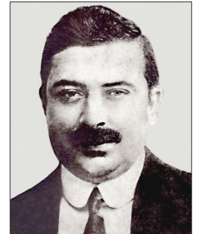
Mûsâ Süreyyâ Bey

Dönemin önemli mûsikîşinasları arasında yer alan Mûsâ Süreyyâ Bey hocalığı ve özellikle bestekârlığıyla tanınmıştır. Mûsikiye olan kabiliyetinin küçük yaşlarda ba-