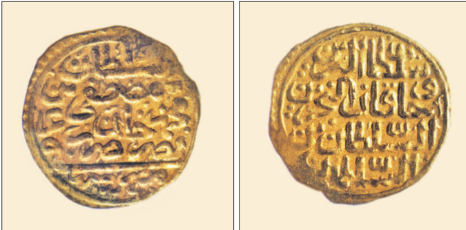
I. Mustafa dönemine ait altın sikke