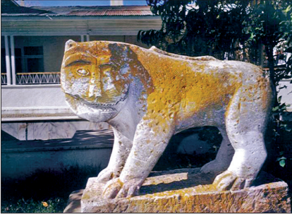
Aslanlı Han'a adını veren aslan heykeli