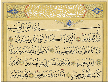
Mutaffifin süresinin ilk âyetleri

bını verme şeklinde belirlenir. Bu arada ebedî hayatta barınacakları yerin cehen-nem olacağı da vurgulanır (âyet 7-17).