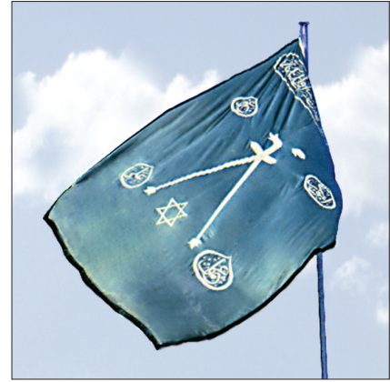
Üzerinde mühr-i Süleyman'ın bulunduğu Barbaros sancağı

Altı köşeli yıldız motifinin Ortadoğu coğrafyasında Tunç devrinden itibaren sıkça kullanıldığı arkeolojik kalıntılardan anlaşılmaktadır. Helen, Roma, İbrânî, Asur, Sumer, Bizans gibi eski medeniyetlerden günümüze ulaşan eşya ve eserler üzerinde göze çarpan bu yıldız eski Türkler'in on iki hayvanlı Türk takviminde bir sembol ola-