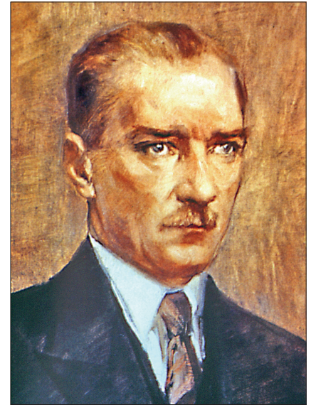
Mustafa Kemal Atatürk'ün İbrahim Çallı tarafından yapılan yağlı boya bir tablosu

Atatürk'ün tarihe verdiği önem ve ortaya atılan yeni tarih tezi, genç Türkiye Cumhuriyeti'nin kültür temelini millî kültürün oluşturmasını istemesinden kaynaklanıyordu. Millî devletin ve on yıldan beri savaştan yorgun düşen Türk milletinin canlanması, Türkiye Cumhuriyeti'ni çağdaş medeniyet seviyesine ulaştırması ancak millî ruhla mümkün olurdu; millî ruhun kaynağı ise tarihti. Atatürk, "Büyük