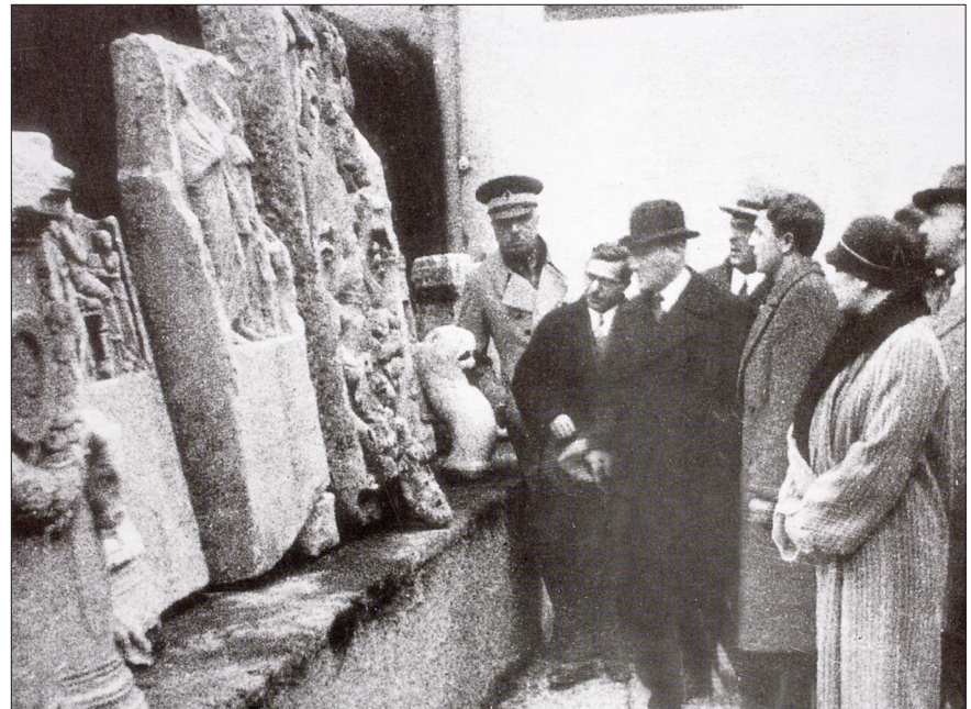
Mustafa Kemal Atatürk, İstanbul Arkeoloji Müzeleri’nde sergilenen taş eserlerden bazılarını incelerken

Atatürk’ün Türk sanatına sevgisi, daha açık bir şekilde Konya üzerinden yaptığı Adana seyahati sırasında yolladığı bir telgraftan anlaşılabilir. 18 Şubat 1931’de Konya’ya gelen Atatürk burada kaldığı on bir gün içinde gerek Mevlânâ Müzesi gerekse diğer eski eserlerle ilgilenme imkânı bulmuştu. Buradan Başbakan İsmet İnönü’ye çektiği telgrafın, Atatürk’ün eski eserler ve bilhassa Türk mimari anıtları hakkındaki görüş ve temennilerini göstermesi dolayısıyla burada kaydedilmesi yerinde olacaktır: “Son tetkik seyahatlerimde muhtelif yerlerdeki müzeleri ve eski sanat ve medeniyet eserlerini de gözden geçirdim. İstanbul’dan başka Bursa, Antalya, Adana ve Konya’da mevcut müzeleri gördüm. Bunlarda şimdiki kadar bulunabilen bazı eserler muhafaza olunmakta ve kısmen de ecnebi mütehassısların yardımıyla tasnif edilmektedir. An-