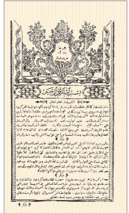
Münşeâtü's-selâtin 'in ilk sayfası (İstanbul 1274)