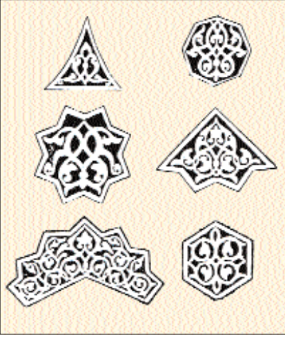
Müstansiriyye Medresesi'nin süslemelerindeki bazı desen örnekleri

arka kısmındaki dershane, muhtemelen kütüphane ve medrese idaresinin bulunduğu büyük salonların dar fakat iki kat yükseklikte girişleri, tavanında ışıklandırma ve hava için belli aralıklarla dört pencere açılmış tonozlu bir koridor bulunmaktaydı. Bu bölümde Halife Müstansır-Billâh'ın dersleri takip etmek istediğinde girdiği, binanın doğu duvarı dışından açılmış küçük bir kapı vardı.