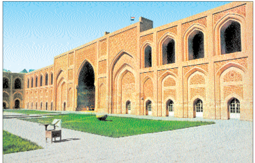
Müstansiriyye Medresesi'nin avlusundan bir görünüş

Girişin tam karşısında 21,50 m. uzunluğunda, 6,50 m. genişliğinde, ortadaki daha büyük üç kemerle avluya açılan uzun oda, mihrap olarak düzenlenmiş nişten de anlaşılacağı gibi mescid olarak planlanmıştır. Alt katta kibleye göre mescidin sağındaki bölüm Şâfiîler'e, solundaki bölüm Hanefîler'e tahsis edilmişti. Taçkapıdan girildiğinde sağdaki bölüm Hanbelîler'e, Hanefîler'in karşısına düşen soldaki bölüm ise Mâlikî mezhebi mensuplarına ayrılmıştı. Dikdörtgen avlunun dar kenarlarının ortalarında yer alan eyvanlardan doğudaki Hanefîler'e, batıdaki Şâfiîler'e aitti. Avluya açılan eyvanların genişliği 6 m., uzunluğu 7,80 m. olup tavanları iki katın yüksekliğine ulaşmakta ve cephesi bina seviyesini biraz aşmaktaydı. Her katta otuz dokuz küçük oda, ayrıca orta büyüklükte birkaç oda ile çeşitli ölçülerde çapraz tonozlu çatısında ışık ve hava için penceresi olan yüksek tavanlı on iki büyük oda bulunmaktaydı. Girişin sağında ve solunda motifli tuğlalarla süslenmiş avluya açılan birer küçük eyvanın hemen yanlarından iki, mescidin sağ ve solundan iki, Şâfiî eyvanının iki yanındaki odalardan sonra birer olmak üzere zeminden üst kata çıkmak için altı adet merdiven mevcuttu. Buradan avluya bakan pencerelerden ışık alan revak şeklindeki koridorlara çıkılırdı. Öğrencilerin ikamet için yapılmış odaların kapıları bu koridora açılmaktaydı. Binanın doğu bölümünde Hanefîler'e tahsis edilen eyvanın