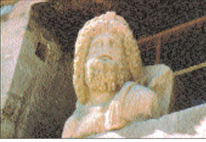
Petra'da Nabatiler dönemine ait bir insan heykelinin baş kısmı

landıkları dil ve kültürleriyle Araplar'a da ha yakındırlar. Kral ve kraliçelerinin Hâris, Mâlik, Zeyd, Ubâde, Şükayle ve Cemile gibi Araplar'la ortak adlar kullandıkları görülmektedir. Bugünkü Arap yazısı da Nabatî yazısının geliştirilmiş şeklidir (bk. ARAP [Yazı]).