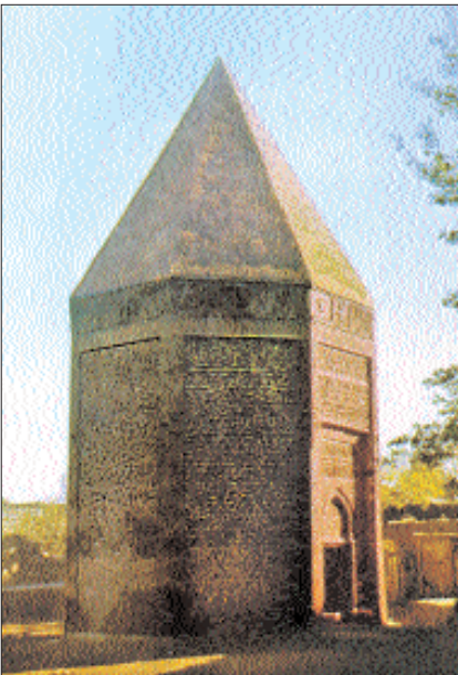
Nahcivan'da XII. yüzyıla ait Yüsusuf b. Küseyr Kümbeti

Nahcivan tarih boyunca önemli ticaret yolları üzerinde bulunmasıyla ön plana çıkmıştır. İldenizliler Devleti'nin başşehri olduğu dönemde burada dokumacılık, inşaat, demircilik, halıcılık, kuyumculuk vb. alanlar başlıca zanaat dallarını oluşturuyordu. Üretilen mallar Nahcivan çarşısında satılır