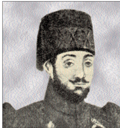
Nâmık Paşa ve gençlik resmi

Bağdat valiliğinden ikinci defa ayrıldıktan sonra serasker (1868, 1875), Şûrâ-yı Devlet reisi (1871, 1876) ve Bahriye nâzırı (1872, 1875) oldu. Şûrâ-yı Devlet riyâsetinde fazla kalmayan Nâmık Paşa, Meclis-i Vükelâ'ya tayin edildi. Kânûn-ı Esâsî'nin hazırlanmasıyla ilgili çalışmalara katıldı. Onun düşüncesi İngiliz Parlamentosu gibi bir yapılanmanın sağlanması olup sadece müslümanlardan oluşacak bir meclise taraftardı. Bu görüşlerini kabul ettiremediyse de sonraki yıllarda II. Abdülhamid üzerinde önemli ölçüde etkisi olduğu ve çeşitli konularda kendisinin önde gelen danışmanları arasında yer aldığı anlaşılmaktadır. II. Abdülhamid döneminde önce Meclis-i A'yân üyeliğine (1877), ardından