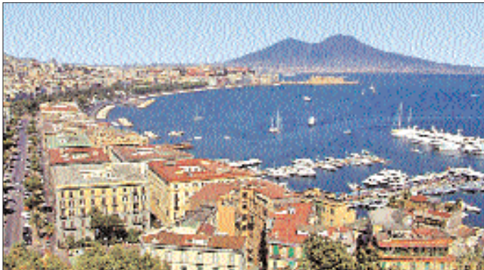
Napoli'den bir görünüş

Napoli Krallığı Levant ticaretiyle ilgilendi ve Mısır ile ticarî bağ kurdu. İskenderiye'de bir ticaret bürosu mevcuttu. Napoli Krallığı, Bizans ve Anadolu'daki Türk beylikleriyle temas kurmakta gecikti. Osmanlı Devleti'yle olan ilişkiler Yıldırım Bayezid döneminde başlar. XIV. yüzyılın sonlarına doğru Napolililer'in Bursa'da kendilerine ait bir deposu ve ticaret merkezi bulunduğu bilinmektedir. Ancak bu ticaret sınırlı kaldı. Kral Alfonso 1442'de Sicilya ve Napoli'yi birleştiren (Sicilyateyn / iki Sicilya krallığı) Arnavutluk ve Adriyatik sahillerine kadar ulaşan Türkler'e karşı harekete geçme ihtiyacı hissetti. Daha önce 1436'da bir Türk elçisinin Napoli'ye geldiği tesbit edilmektedir. Napoli ile olan ilişkiler, İskender Bey tarafından başlatılan isyan sebebiyle Arnavutluk kesiminde yoğun bir siyasî çatışmaya dönüştü. İskender Bey memleketinden ayrıldıktan sonra Napoli Krallığı'nın himayesine girdi. İstanbul'un fethi sırasında başta devrin papası V. Nicolò tarafından kurulması istenen koalisyonlara katılması için teşvik edildiye de Napoli tahtında bulunan Aragona hânedarı