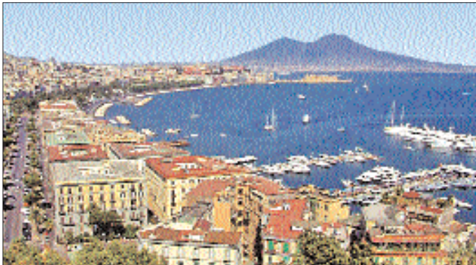
Napoli'den bir görünüş

Napoli Krallığı Levant ticaretiyle ilgilendi ve Mısır ile ticarî bağ kurdu. İskenderiye'de bir ticaret bürosu mevcuttu. Napoli Krallığı, Bizans ve Anadolu'daki Türk beylikleriyle temas kurmakta gecikti. Osmanlı Devleti'yle olan ilişkiler Yıldırım Bayezid döneminde başlar. XIV. yüzyılın sonlarına doğru Napolililer'in Bursa'da kendilerine ait bir deposu ve ticaret merkezi bulunduğu bilinmektedir. Ancak bu ticaret sınırlı kaldı. Kral Alfonso 1442'de Sicilya ve Napoli'yi birleştiren (Sicilyateyn / iki Sicilya krallığı) Arnavutluk ve Adriyatik sahillerine kadar ulaşan Türkler'e karşı harekete geçme ihtiyacı hissetti. Daha önce 1436'da bir Türk elçisinin Napoli'ye geldiği tesbit edilmektedir. Napoli ile olan ilişkiler, İskender Bey tarafından başlatılan isyan sebebiyle Arnavutluk kesiminde yoğun bir siyasî çatışmaya dönüştü. İskender Bey memleketinden ayrıldıktan sonra Napoli Krallığı'nın himayesine girdi. İstanbul'un fethi sırasında başta devrin papası V. Nicolò tarafından kurulması istenen koalisyonlara katılması için teşvik edildiye de Napoli tahtında bulunan Aragona hânedarı