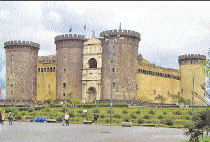
Napoli Kalesi - İtalya