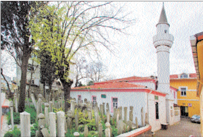
Nasûhî Tekkesi – Üsküdar / İstanbul

Cami-tevhidhâne hariminin selâmlığa bitişik olan batı duvarı sağır bırakılmış, güney duvarının eksenine yanlarında ikişer pencere ile mihrap, giriş (kuzey) cephesinin üst kesimine beş pencere, batı duvarına da türbeye açılan kemerli bir niyaz penceresi yerleştirilmiştir. Bu açıklığı içeriden barok üslûbunda kaidelere oturan yivli pilastırlar kuşatmakta, yuvarlak bir kemer taçlandırmakta, cephede bu pencerenin üstünde ta'lik hatlı yazılmış şu beyit yer almaktadır: "Makâm-ı evliyâdır menba-ı feyz-i fütûhîdir / Edeble dâhil ol sûfî bu dergâh-ı Nasûhî'dir." Bu beytin, Nasûhî Efendi'nin Risâle-i Velediyye adlı eserini şerheden Mustafa Zekâî Efendi'ye ait olduğu nakledilmektedir. Mekânın kuzeyinde uzanan 3 m. derinliğindeki iki katlı mahfillerin sınırında kare kesitli dört adet ahşap dikme sıralanır. Harimin kuzeybatı köşesinde yer alan ve türbeye doğru çıkıntı yapan merdivenle ulaşılan fevkanî mahfilin her ikisinde de dikmelerin arası ahşap korkuluklarla kapatılarak ortadaki açıklık yarım daire planlı bir çıkma ile genişletilmiştir. Kuzeybatı köşesindeki açıklık ise oymalı ahşap kafeslerle donatılmak suretiyle hünkâr mahfiline dönüştürülmüştür. Hafifçe dışa taşan yarım daire planlı mihrap nişi son yıllarda turkuaz renkli fayanslarla kaplanmıştır. Ahşap minber, kapısında ve köşkünde bulunan neo-gotik üslû-