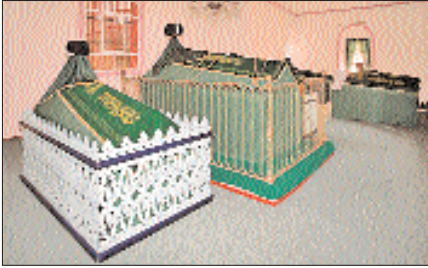
Nasûhî Türbesi'nin kitabesi ile içinden bir görünüş

bundaki üç merkezli kemerleriyle Abdülaziz döneminin eklektik zevkini yansıtmaktadır. Duvarlarda herhangi bir bezeme bulunmamakta, çubuklu tavanın merkezinde çatalarla oluşturulmuş sekizgen bir göbek yer almaktadır. Dikdörtgen planlı (13,50 × 5,50 m.) türbenin girişi kuzeydoğu köşesinde minare kaidesinin yanındaki girintidedir. Batı duvarında cami-tevhidhâne harimine açılan niyaz penceresinden başka doğu duvarında üç, kuzey ve güney duvarlarında birer pencere vardır.