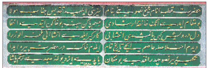
Nasûhî cami- tevhidhânesinin kitabesi

Hallâc-ı Mansûr insanın beşerî (maddî) yönünü Süryânice nâsût, ilâhî (mânevî) yönünü de lâhût kelimeleriyle ifade etmiş, bu iki terim daha sonra çeşitli sûfiler tarafından kullanılmıştır. Hallâc'a göre insan Allah'ın ezelde kendisinden çıkardığı bir sûrettir, Allah gizli olan güzelliğini ve sırrını onda izhar etmiştir. Bu sûretin nâsût ve lâhût olmak üzere iki tabiat ve âlemden oluştuğunu ve iki âlemin ayırt edilemeyecek şekilde birbiriyle mezcedildiğini söyleyen Hallâc, "Allah Âdem'i kendi sûretinde yaratmıştır" hadisini (Buhârî, "İsti-