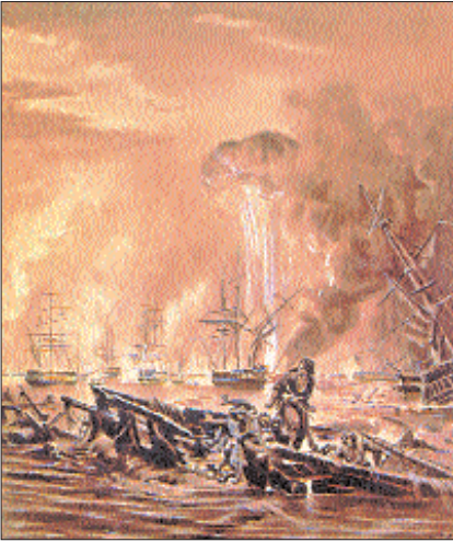
1827 Navarin savaşının tasvir edildiği bir tablo (İstanbul Deniz Müzesi, Hüsnü Tengüz Albümü)

rihinde "Navarin faciası" diye geçen bu haksız tavır karşısında Osmanlılar müttefiklerden tazminat talep ettiyse de bir sonuç alınmadı (Lutfi, I, 65). Yalnız İngiliz Amiralî Codrington yapılanlardan sorumlu tutularak görevinden azledildi. Navarin, müttefiklerin baskısı ile bir tahliye anlaşması imzalanıncaya kadar İbrâhim Paşa'nın idaresinde kaldı. 29 Ağustos 1828'de Navarin'e gelen bir Fransız ordusu burayı teslim aldı; böylece şehir kesin olarak Türk idaresinden çıkmış oldu.