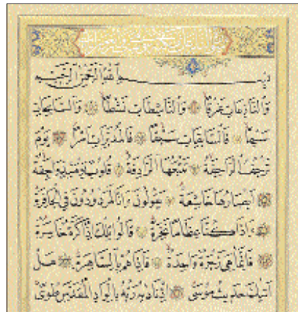
Nâziât sûresinin ilk âyetleri

1988) adlı çalışmaları sayılabilir. Urduca'da da çok sayıda Amme cüzü tefsiri yapılmıştır (Cemîl Nakvî, s. 97-109).