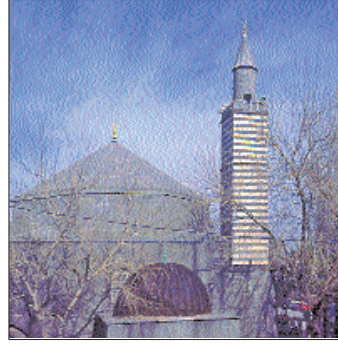
Nebi Camii ve planı