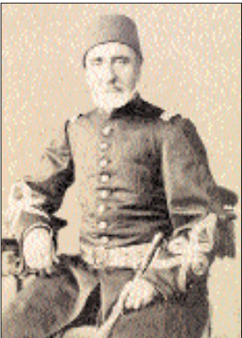
Yesârîzâde Necib Ahmed Paşa

İstanbul'da doğdu. Ünlü hattat Yesârîzâde Kazasker Mustafa İzzet Efendi'nin büyük oğludur. 1824'te Enderun'a alındı. Babasının ve dedesinin görev yaptığı Enderun'da başladığı eğitimine 1831'de Muzika-i Hümâyun'a geçerek devam etti. 1846'da mülâzım rütbesiyle saray bandosuna flütist olarak alındı. Aynı yıl yüzbaşı, kolağası ve binbaşı, 1854'te kaymakam, ardından miralay oldu. Bir yıl sonra miralivâliğe, 1859'da ferikliğe terfi ettirildi. Giuseppe Donizetti'nin 1856'da ölümü üzerine Muzika-i Hümâyun kumandanlığına getirilen Necib Ahmed Paşa, Sultan Abdülaziz'in tahta çıkmasıyla mâbeyin orkestra ve bandolarını kaldırıp yerine saz takımlarını kurduğunu hoş karşılamadığı için azledilerek mîrimîran rütbesiyle Rüşûmat meclisi üyeliğine getirildi. II. Abdülhamid'in tahta geçmesi üzerine yeniden ferik rütbesiyle Muzika-i Hümâyun kumandanlığına döndü ve bu görevde iken 28 Nisan 1883 tarihinde vefat etti. Padişahın isteğiyle II. Mahmud Türbesi haziresine defnedildi.