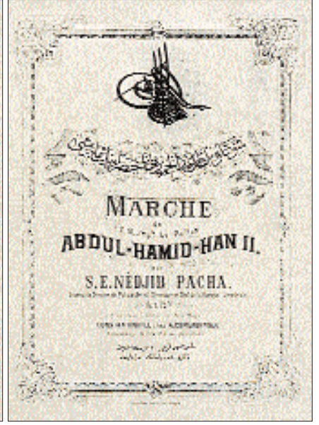
Yesârîzâde Necib Ahmed Paşa'nın bestelediği Hamidiye Marşı'nın kapağı ile ilk sayfası

Dönemin müsiği çevrelerinde önemli yeri bulunan Necib Paşa bestekârlığı ve yöneticiliğinin yanı sıra özellikle nota koleksiyonculuğu ile tanınmıştır. Küçük yaşlarda babasından ve onun arkadaşları olan müsiği üstatlarından aldığı derslerle müsiği çalışmalarına başlamış, Muzika-i Hümâyun'a geçince buradaki hocalardan ve özellikle G. Donizetti'den flüt, keman ve piyano dersleri almıştır. Ayrıca armoni ve bando konusunda bilgi edinmiş, Sultan Abdülmecid'in huzurunda yapılan Batı müziği icralarında padişahın hoşlanacağı opera parçalarının arasına bazı yeni parçalar koyarak programları zenginleştirmiştir. Yine böyle bir programda padişah hoşuna giden bir bölümü tekrar çaldırarak bunun ki-me ait olduğunu sormuş, eserin Necib Paşa'ya ait olduğu söylendiğinde onu huzuruna çağırıp miralaylığa terfi ettirmiştir. İkinci defa Muzika-i Hümâyun kumandanlığına getirildiği yıl bestelediği, "Ey velîni-met-i âlem şehinşâh-ı cihan" mısraıyla başlayan Hamidiye (I. Meşrutiyet) Marşı, 1908'de II. Meşrutiyet'in ilânına kadar Osmanlı Devleti'nin resmi marşı olmuştur. Marşın en önemli özelliği güftesi bulunan ilk resmî marş olmasıdır.