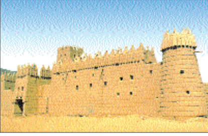
Necran'da emirlik sarayı

lanılır (el-Burûc 85/4-9; bk. ASHÂBÜ'UH-DÛD; BURÛC SÛRESİ).