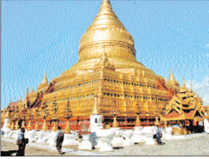
Yangon'un 80 km. kuzeyindeki Bago'da (Pegu) Büyük Altın Tapınak - Myanmar

bölgesinde yaşayan Rohingyalar'dır. Bengal, Urdu, Burma dillerinin bir karışımı olan ve kendi adlarını taşıyan dili konuşan bu grubun nüvesi Bengal kökenlidir ve bölgedeki XV ve XVI. yüzyıllarda yaşayan Bengal Sultanlığı'nın hâkimiyet yıllarında oluşmuştur. Diğer müslümanlara göre daha fakir olan Rohingyalar savaş, sürgün ve baskılara mâruz kalma gibi önemli sıkıntılar yaşadılar. Özellikle II. Dünya Savaşı'nın ardından başlatılan, Arakan'da bağımsız bir müslüman devleti kurma çalışmalarını silâhlı çatışmalara yol açtı ve hükümetin askerî operasyonlarıyla binlerce müslüman yurtlarından çıkarılırken camileri, okulları ve evleri zarar gördü. Bunlardan geri dönenleri hükümet ülkeye kaçak yollardan giren yabancılar olarak değerlendirdi. 1989 ve 1991'deki operasyonlar neticesinde 250.000 Arakanlı müslüman tekrar Bangladeş'e sığındı ve ancak Birleşmiş Milletler Mülteciler Yüksek Komiserliği'nin bas-